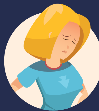
LETARGO O CONFUSIÓN