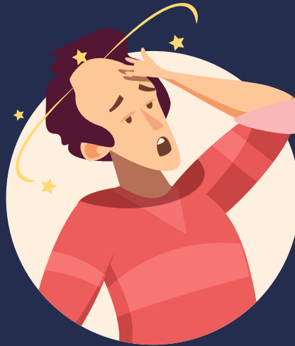
MAREOS O ALTERACIÓN VISUAL