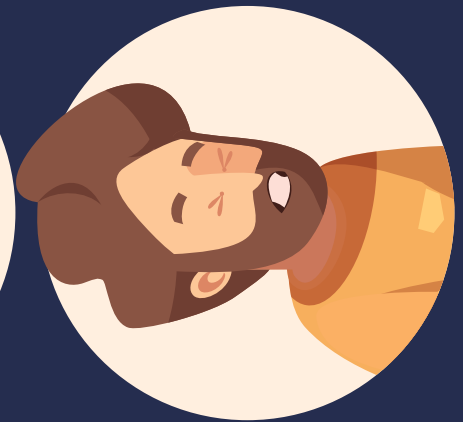
DESMAYOS O CONVULSIONES