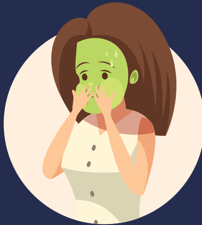
NÁUSEAS O VÓMITOS